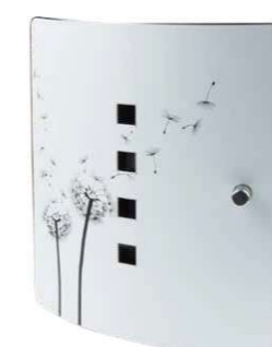
Diente de león

Nos reservamos el derecho de cambiar la colección. Encontrará nuestro surtido actual como siempre en www.burg.biz