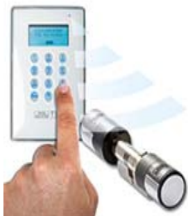
Apertura mediante código pin