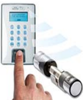
Apertura mediante código pin y huella dactilar