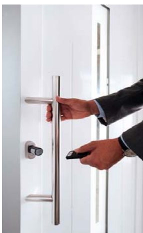
Apertura mediante mando a distancia incopiable E-Key