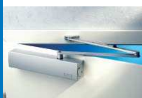
TS 4000 V S