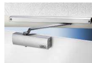
GTS 513 S