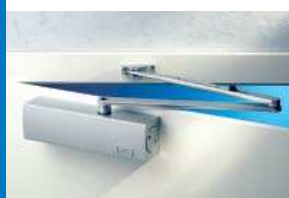
TS 2000 V S