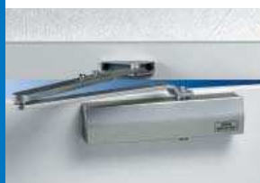
TS 503 S