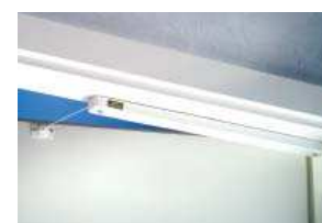
TR 86 W