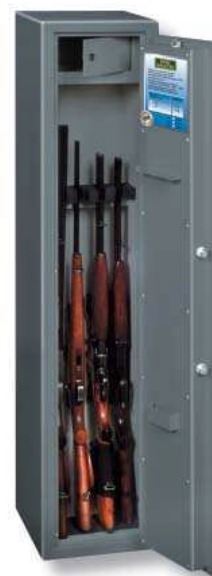
Ranger A 5