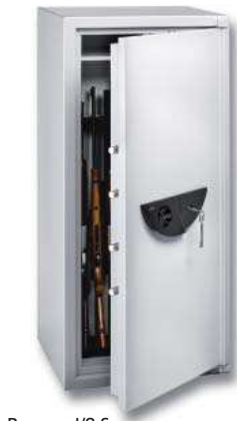
Ranger I/8 S