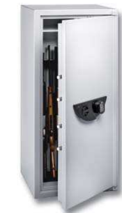
Ranger I/8 E

Conforme al § 36 ley alemana sobre armas, 04/2009. BURG-WÄCHTER recomienda el modelo Ranger I/8 para la custodia de armas cortas y munición.