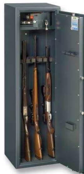
Ranger W 7 A/B